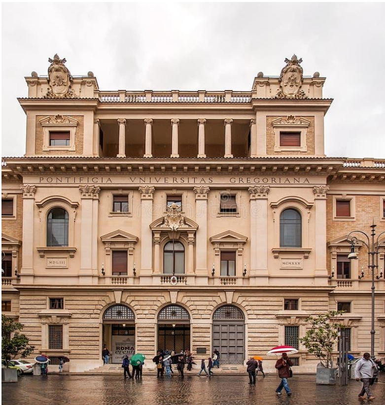
De Pauselijke universiteit Gregorianum

hoeft de wijsbegeerte niet in de weg te staan. Het derde tijdperk was die van Duitse invloed met een fase van intellectualisme met Meester Eckart (omstr. 1300) met veel invloed. De schepping was uit zichzelf impliciet noodzakelijk zoals die was met bijbehorende eigenschappen; zonder 'externe' schepper. De vierde fase van de filosofie van de Moderne Devotie van Dionysis de Kartuiser (1402-1471) ziet Brandsma als een hoogtepunt. Het wordt een beweging van leken en burgers. Deze is radicaal maar brengt een harmonische relatie tussen contemplatie en actie. Het optreden van D. de Kartuiser zou boven Aristoteles en Plato uitstijgen. Het was het hoogtepunt van de lange zoektocht van de Nederlandse wijsbegeerte vond Brandsma. Het was een