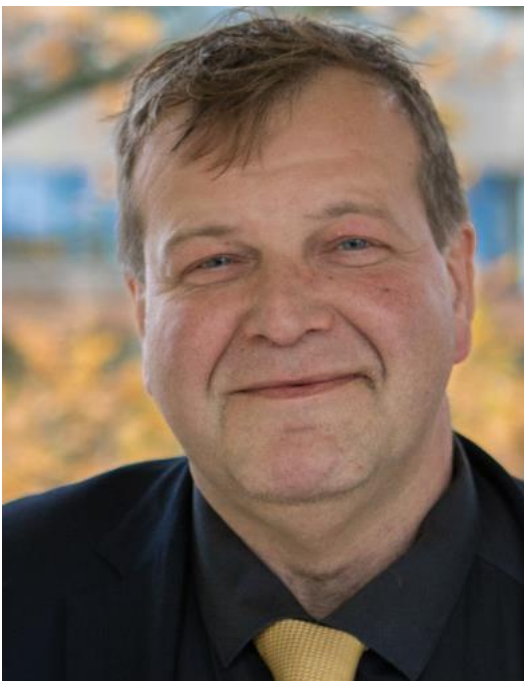
Dr. I.M.K. Bocken (Inigo)

Een Friese boerenjongen die de Paus er toe brengt hem postuum heilig te verklaren op 15 mei 2022. Een knappe prestatie. De schrijver Inigo Bocken neemt vijf jaar de tijd om de ‘ intellectuele biografie ’ van Titus op te stellen getiteld ‘ Denker voor Gods aangezicht ’ uitgegeven 2024 door TB Instituut geïnitieerd als geschenk aan de 100 jarige Radboud Universiteit.