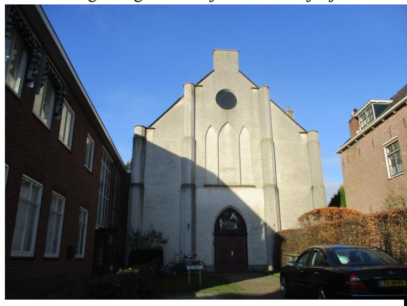
Voormalig kerkgebouw waar Titus zijn eerste eucharistie opvoerde

ondermelk werd aan de kalveren gevoerd. Een arbeidsintensief proces en de moeder Tsjitsje werkte vaak tegen overspannenheid aan om alles gedaan te krijgen. Plaats voor emoties en openlijke genegenheid was er niet; dat soort persoonlijke kwesties diende men door gebed en godsdienstige overpeinzing te gerieven. Spelletjes doen bestond uit meehelpen en contact met de dieren. Maar Titus had wel een stille plek in het hooi waar hij zich kon terugtrekken en in eenzaamheid deed hij spontaan contemplatieve oefeningen. In het alleen zijn ontdekte hij de mystieke stilte wat lichamelijke en rationele (gedachten) activiteit tot rust brengt om enkel nog het zelf te beleven. Waar dit opgaat in het groter geheel kwam er een gevoel van grote harmonie die de jongen doorgloeide met een verheffende trance toestand die overtuigende Kosmische verlichting bracht. Wonderlijke belevingen deel uit te maken van de Kosmos zeker met het besef ook nog mens te zijn in een verder warme, sociale en religieuze omgeving want gelovig waren zijn moeder Tsjitsje Postma en vader Titus allebei.