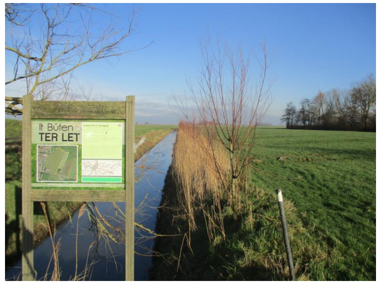
Wandelroute langs de Hartwerdervaart met zicht op buurtschap Ugoklooster

Schrijver Bocken maakt in zijn werk van 635 pagina's op dat het nationaal socialisme van de Nazi's volgens Brandsma was gebaseerd op afwijkende filosofieën in het verlichtingstijdperk. In publicaties, redes en collegedictaten gaf hij toe dat katholieke vernieuwingsdenkers zich lieten verleiden door monistische, naturalistische ideologieën, communisme, fascisme en nationaal socialisme wat de reputatie van het katholiek denken niet ten goede kwam. Hij was dus ook kritisch op zijn eigen organisatie.