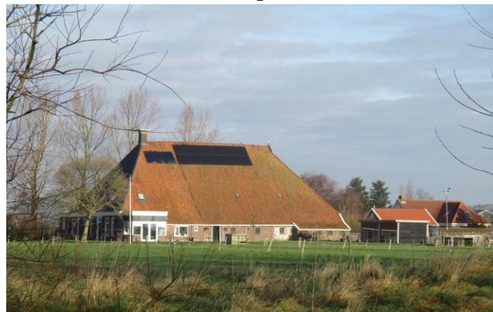
Geboorte plaats Titus Ugoklooster 2

Geboren 23 februari 1881 was een tijd dat koeien nog met de hand werden gemolken. De melk werd in langwerpig vierkantige schalen in de kelders bewaard om te romen. Met een sleef werd de room geoogst en gekarnd tot boter. De boter en room bevatte de meest essentiële voedingswaarde. De