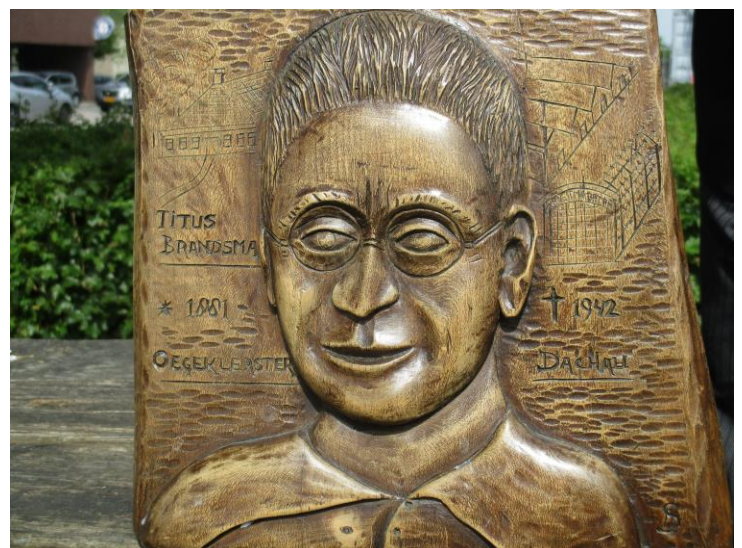
Houtreliëf van Titus door een medegevangene